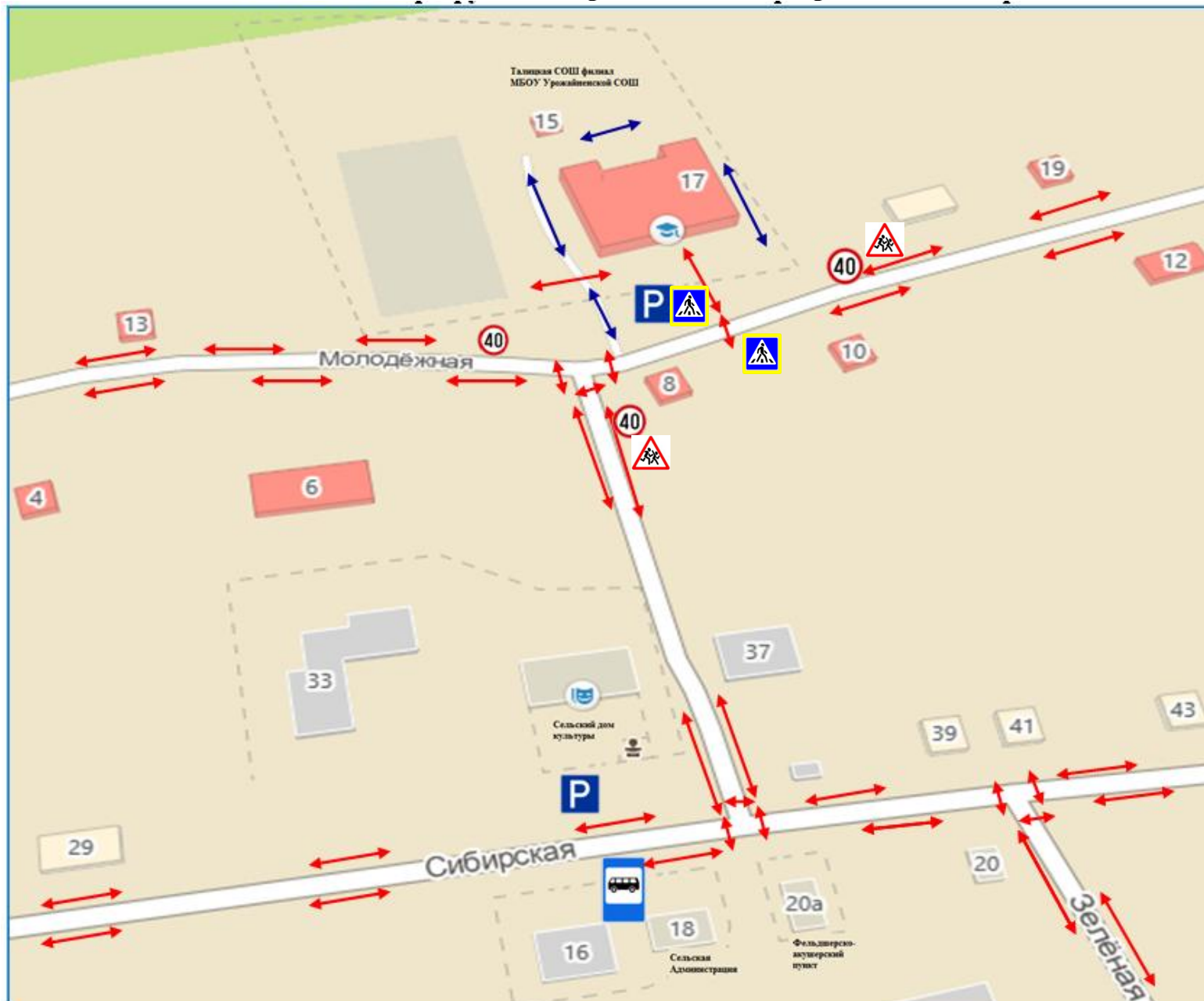
Схема организация дорожного движения в непосредственной близости от образовательной организации с размещением соответствующих технических средств организации дорожного движения, маршруты движения детей и расположение парковочных мест.